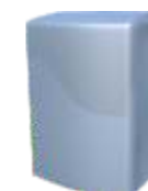
Tope plano Flat top Topo plano