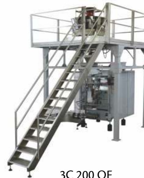
3C 200 OF